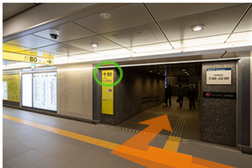
改札を出たら、B0出口に向かいます