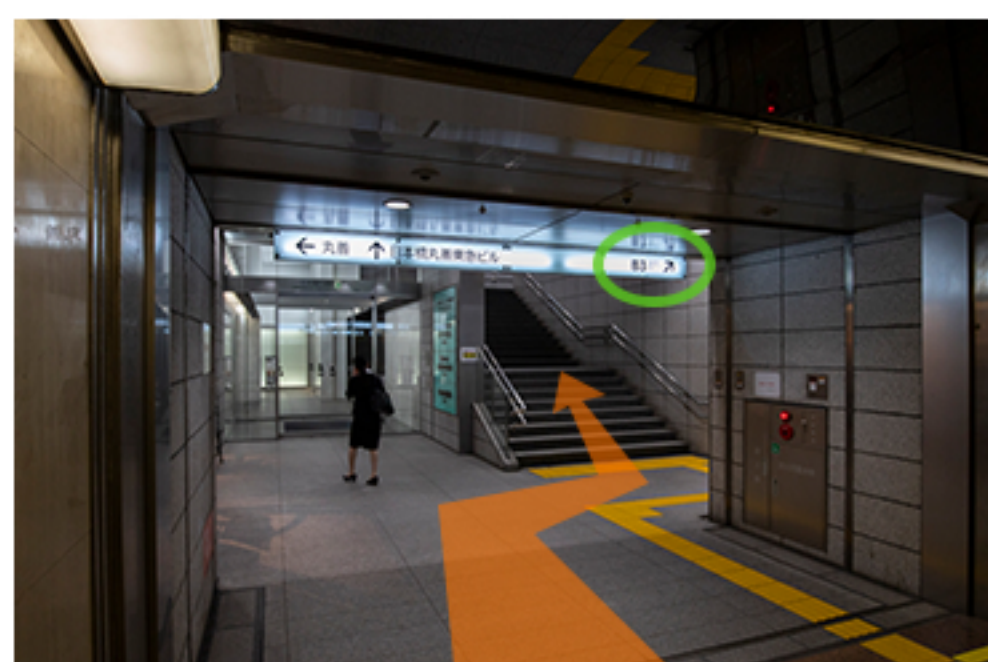
B3出口を出たら左に曲がります