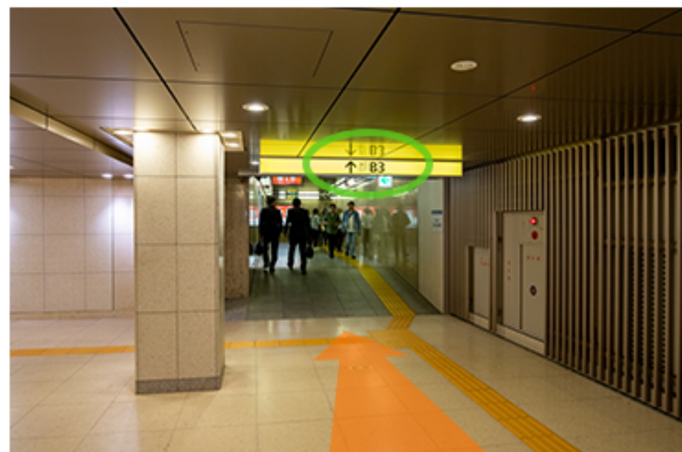
改札を出たら、B3出口に向かいます