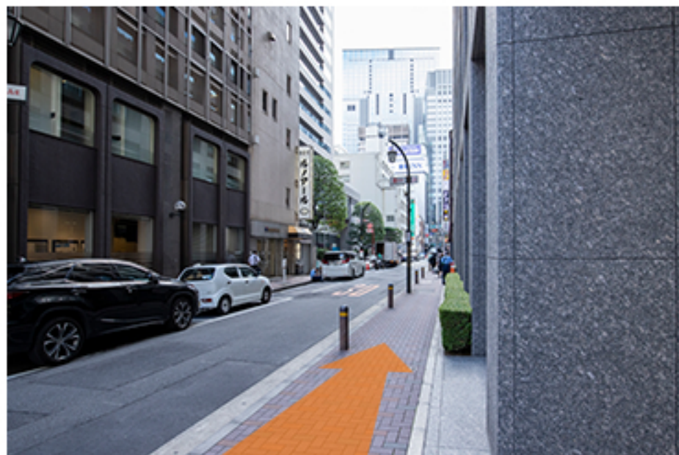
400mほど真っすぐ進むと、 左手にホテルがございます